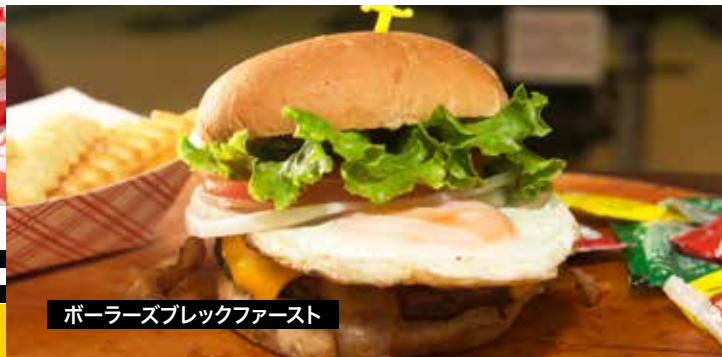
ボウラーズブラックファースト

+ ドリンク・フレンチフライセット .....$3.00 ファウンテンドリンク・クリンクルカット、カーリーフライもしくは ベジーカップのセット