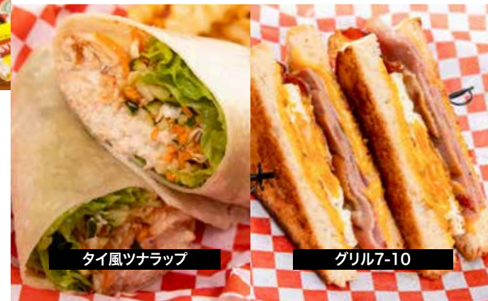
タイ風ツナラップ

BLTラップ (338 cal)..... $6.75 ベーコン、レタス、トマト、ランチ