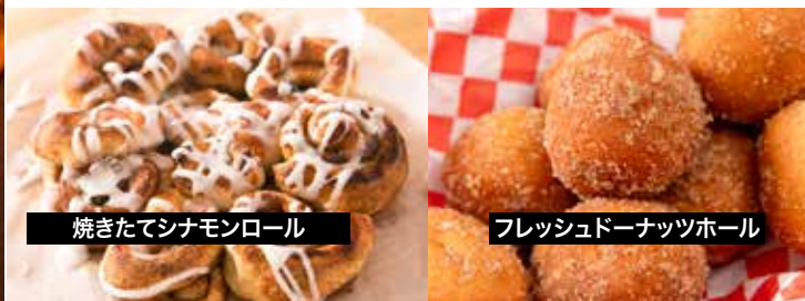
焼きたてシナモンロール