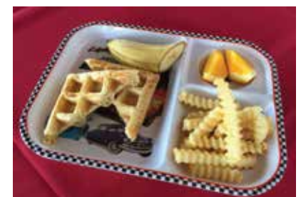
Waffle Set ..... $5.00 キッズプレート(ワッフル)