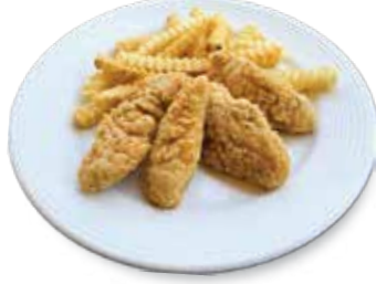
Fried Chicken Tenders .... $7.50 チキンテンダー

1 lb. of Chicken Wings with Home-made Buffalo Sauce - served with Ranch Dressing. (10 pieces). ホームメイドバッファローソースを使用。