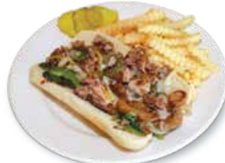
Philly Cheese Steak Sandwich $12.00 フィリーチーズステーキ

Hot Corned Beef & Sauerkraut on Grilled Rye with Melted Swiss Cheese & Thousand Island Dressing. コーンビーフ、サワークラウト、スイスチーズ、サウザンアイランドドレッシングをライパンでサンドイッチ