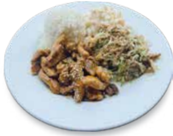
Hawaiian Plate Mix ... $8.95 ハワイアンプレート、ミックス

Teriyaki Chicken served with Steamed Rice & Macaroni Salad. テリヤキチキン、マカロニサラダ、ライス