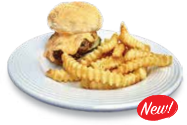
Crispy Chicken Sandwich $11.00 クリスピーチキンサンドイッチ

Grilled Steak with Sautéed Bell Peppers, Onions, Sliced Mushrooms and Melted Mozzarella Cheese served on a Fresh Steak Roll. グリルステーキ、ピーマン、オニオン、マッシュルーム、チーズ