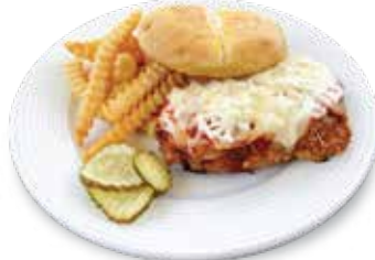
Chicken Parmesan Sandwich $8.95 チキンパルメザンサンドイッチ

Cajun-Style Chicken Breast grilled to perfection. Served with Provolone Cheese. スパイシーチキン、プロボロンチーズ