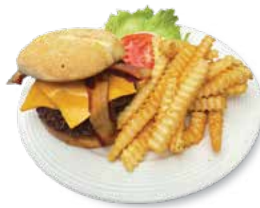
Double Cheese & Bacon Burger ... $15.25 ダブルチーズ&ベーコンバーガー 6 oz. Beef Patty, Cheese and Bacon x2. 6オンスパティ、チーズ、ベーコンx2