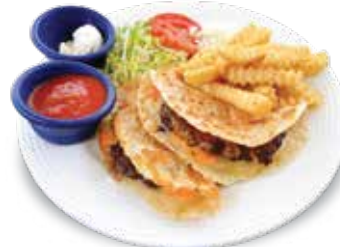
Quesadilla Burger $8.95 ケサディアバーガー

Chicken Thigh, Breaded and Fried, smothered with Tomato Sauce, covered with Mozzarella and Parmesan Cheese.