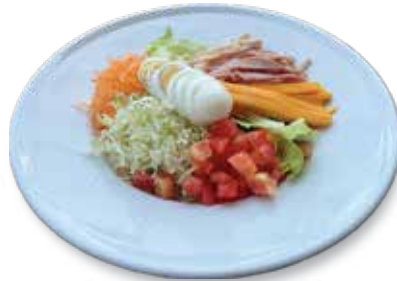
Chef Salad..... $9.95 シェフサラダ

Iceberg Lettuce, Ham, Turkey, American Cheese, Boiled Egg, Tomato, Carrots & Choice of Dressing. レタス、ハム、ターキー、アメリカンチーズ、卵、トマト、人参