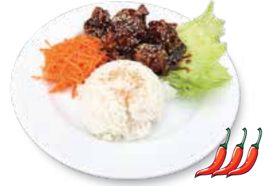
Korean Fried Chicken...$8.95 ヤンニョムチキン

Chicken Thigh marinated and stir fried with Homemade Bourbon Sauce (does not contain alcohol). Served with Steamed Rice, shredded Cabbage and Carrots. 鶏肉をオリジナルバーボンソースに絡めて炒めました。(アルコールは入っていません)