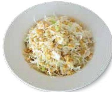
Chinese Chicken Salad....$10.95 チャイニーズ風チキンサラダ

Garden Salad with Sliced Chicken Breast, Shredded Cheese, Boiled Egg & Choice of Dressing. ガーデンサラダ、チキンプレスト、チーズ、卵