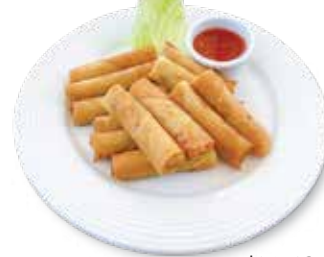
Pork Lumpia ..... $7.50 ポークルンピア

12 pieces, served with Sweet and Sour Sauce. ルンピア12本、スイートサワーソース付き