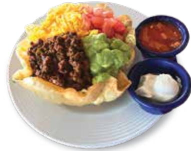
Taco Salad.....$8.95 タコサラダ

Iceberg Lettuce, Ham, Turkey, American Cheese, Boiled Egg, Tomato, Carrots & Choice of Dressing. レタス、ハム、ターキー、アメリカンチーズ、卵、トマト、人参