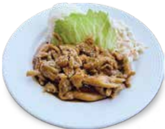
Hawaiian Plate Teriyaki Chicken..... $8.95 ハワイアンプレート、テリヤキチキン

Teriyaki Chicken served with Steamed Rice & Macaroni Salad. テリヤキチキン、マカロニサラダ、ライス