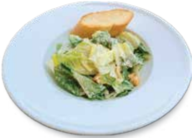
Caesar Salad .....$6.50 シーザーサラダ

Ranch, Thousand Island, Italian, Caesar, Honey Mustard, Sesame Dressing. ドレッシングはランチ、サウザン、イタリアン、シーザー、ハニーマスタード又は胡麻ドレから選べます。