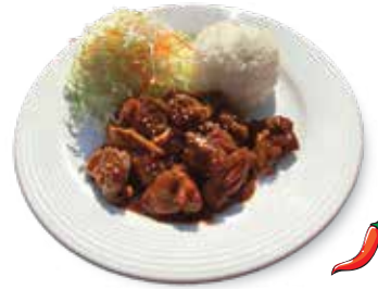
Bourbon Chicken...$8.95 バーボンチキン

Kalua Pork & Teriyaki Chicken served with Steamed Rice & Macaroni Salad. カルアポーク & テリヤキチキン、マカロニサラダ、ライス