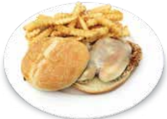
Cajun-Style Chicken Sandwich $9.95 ケイジャンスタイルチキンサンドイッチ

Cajun-Style Chicken Breast grilled to perfection. Served with Provolone Cheese. スパイシーチキン、プロボロンチーズ