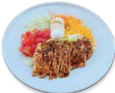
Chicken Breast Salad... $9.95 チキンプレストサラダ

Garden Salad with Chicken Strips, Shredded Cheese, Boiled Egg & Choice of Dressing. ガーデンサラダ、チキンテンドー、チーズ、卵