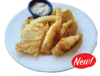
Fish & Chips..... $8.95 フィッシュ&チップス

12 pieces, served with Sweet and Sour Sauce. ルンピア12本、スイートサワーソース付き