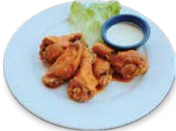
Buffalo Wings..... $8.75 バッファローウィング

1 lb. of Chicken Wings with Home-made Buffalo Sauce - served with Ranch Dressing. (10 pieces). ホームメイドバッファローソースを使用。