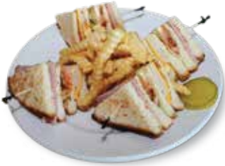
Golf Club Sandwich.....$8.95 ゴルフクラブサンドイッチ

All Sandwiches come with choice of French Fries, Curly Fries, Salad, Vegetable of the day or Coleslaw. フレンチフライ、カーリーフライ、サラダ、温野菜、コールスローの中から一品付け合わせをお選び下さい。