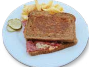
Grilled Reuben Sandwich $8.95 グリルルーベンサンドイッチ

4 Pieces of Toast Served with Turkey, Ham, Cheese, Bacon, Lettuce & Tomato. ターキー、ハム、チーズ、ベーコン、レタス、トマト