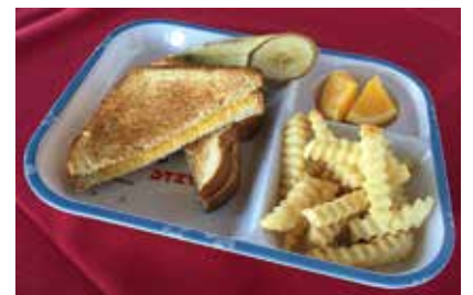
Grilled Cheese Set..... $5.00 キッズプレート(グリルチーズ)