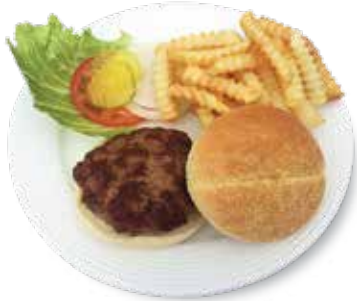
6 oz. Homemade Hamburger .... $8.95 6 オンスハンバーガー

Comes with Lettuce, Tomato, and Onion. Choice of French Fries, Curly Fries, Salad, Vegetable of the day or Coleslaw. レタス、トマト、オニオンが付き。フレンチフライ、カーリーフライ、サラダ、温野菜、コールスローの中から一品付け合わせをお選び下さい。